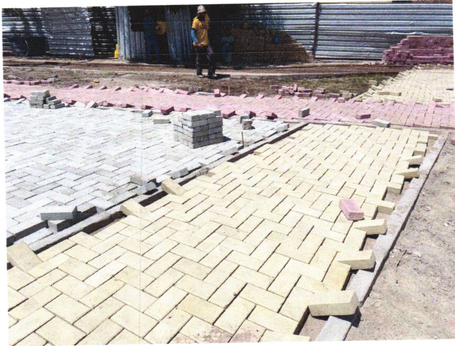
Foto 09- EXECUÇÃO DE PASSEIO EM PISO INTERTRAVADO, COM BLOCO RETANGULAR COLORIDO DE 20 X 10 CM, ESPESSURA 6 CM. AF_12/2015