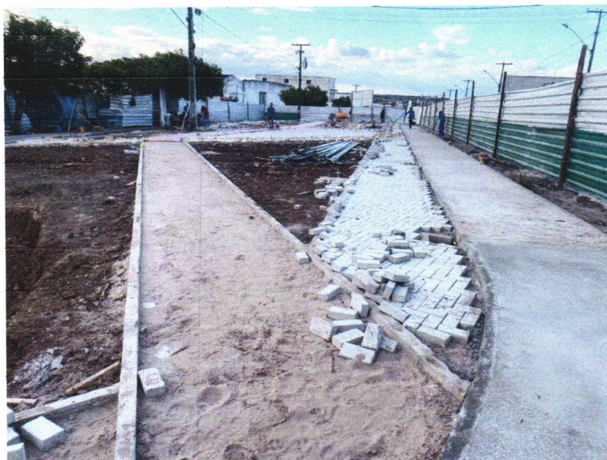
Foto 07 - EXECUÇÃO DE PASSEIO (CALÇADA) OU PISO DE CONCRETO COM CONCRETO MOLDADO IN LOCO, FEITO EM OBRA, ACABAMENTO CONVENCIONAL, ESPESSURA 6 CM, ARMADO. AF_07/2016