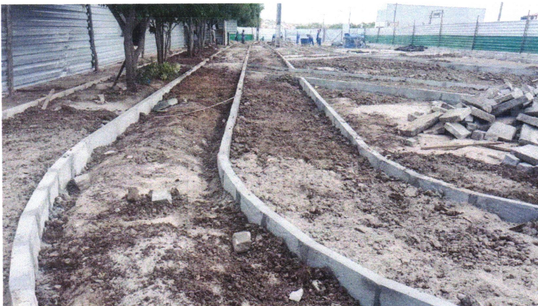
Foto 11- GUIA (MEIO-FIO) CONCRETO, MOLDADA IN LOCO EM TRECHO RETO COM EXTRUSORA, 13 CM BASE X 22 CM ALTURA. AF_06/2016