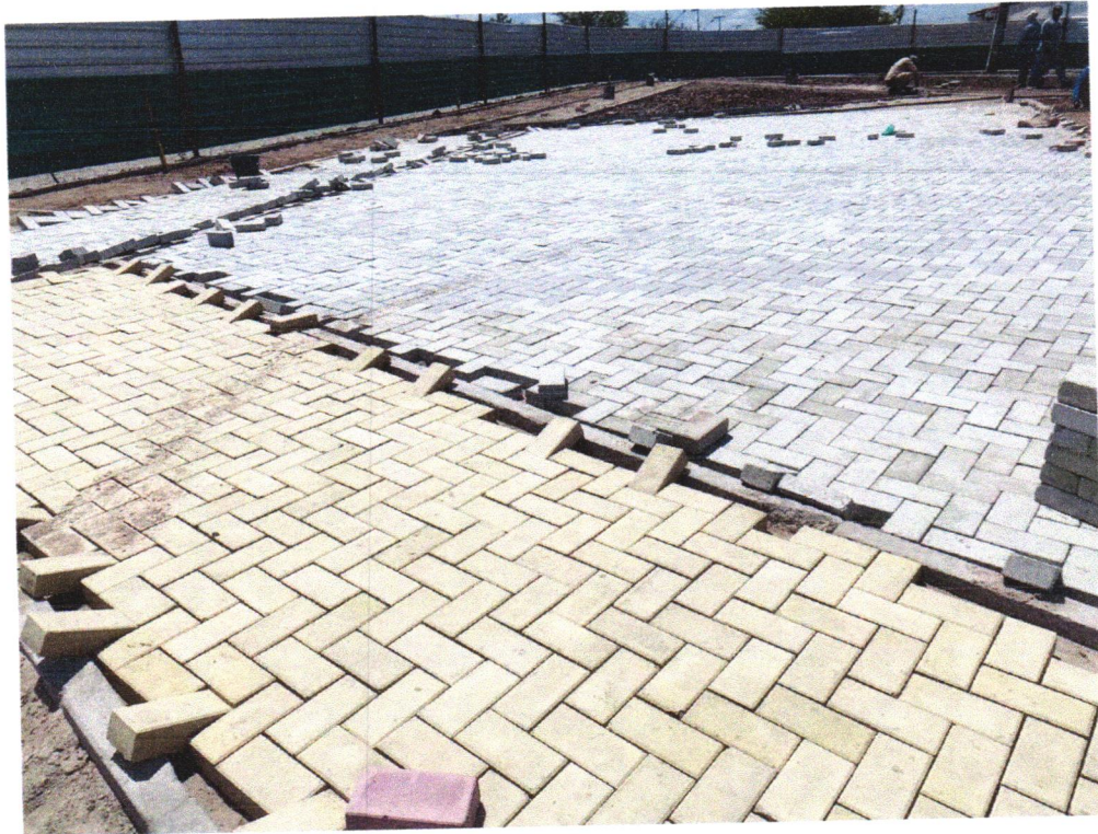
Foto 13 - EXECUÇÃO DE PASSEIO EM PISO INTERTRAVADO, COM BLOCO RETANGULAR COR NATURAL DE 20 X 10 CM, ESPESSURA 6 CM. AF_12/2015