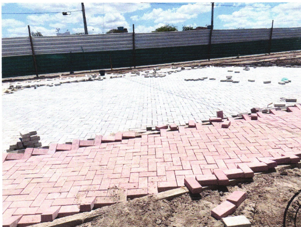
Foto 12 - EXECUÇÃO DE PASSEIO EM PISO INTERTRAVADO, COM BLOCO RETANGULAR COM NATURAL DE 20 X 10 CM, ESPESSURA 6 CM. AF_12/2015

Julia Varjão Julia Varjão Engenheira Civil CREA-BA 300001424