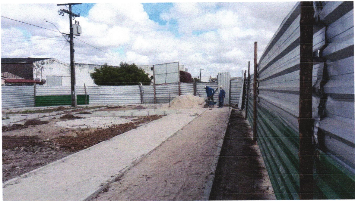
Foto 01 - ATERRO C/COMPACTAÇÃO MECÂNICA E CONTROLE, MAT. DE AQUISIÇÃO