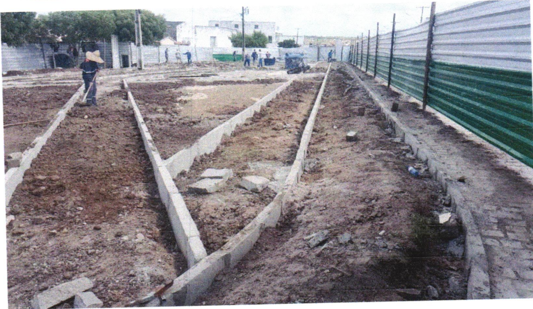
Foto 03- ASSENTAMENTO DE GUIA (MEIO-FIO) EM TRECHO RETO, CONFECCIONADA EM CONCRETO PRÉ-FABRICADO, DIMENSÕES 100X15X13X30 CM (COMPRIMENTO X BASE INFERIOR X BASE SUPERIOR X ALTURA), PARA VIAS URBANAS (USO VIÁRIO). AF_06/2016