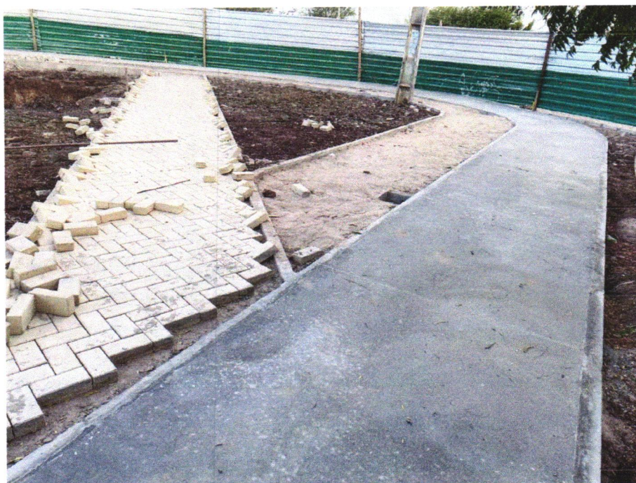
Foto 05 - EXECUÇÃO DE PASSEIO (CALÇADA) OU PISO DE CONCRETO COM CONCRETO MOLDADO IN LOCO, FEITO EM OBRA, ACABAMENTO CONVENCIONAL, ESPESSURA 6 CM, ARMADO. AF_07/2016