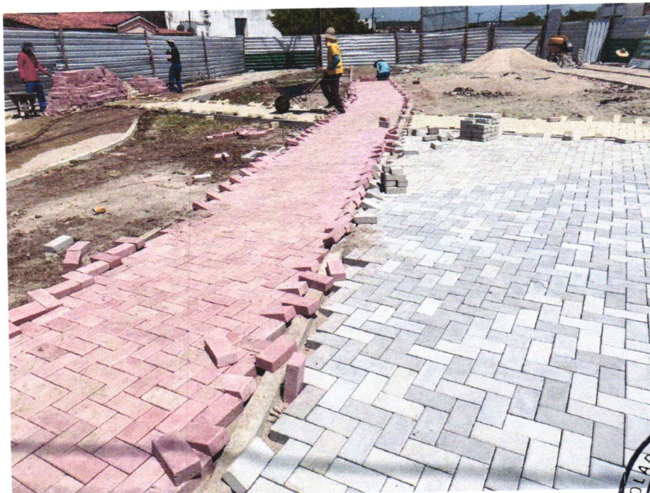
Foto 10 - EXECUÇÃO DE PASSEIO EM PISO INTERTRAVADO, COM BLOCO RETANGULAR COLORIDO DE 20 X 10 CM, ESPESSURA 6 CM. AF_12/2015

Julia Varjão Julia Varjão Engenheira Civil CREA-BA 3000041424