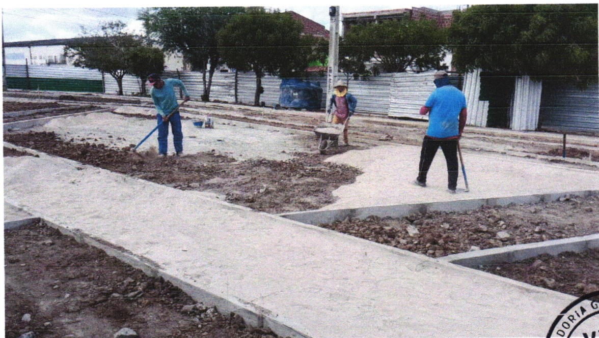
Foto 02 – ATERRO C/COMPACTAÇÃO MECÂNICA E CONTROLE, MAT. DE AQUISIÇÃO

Júlia Varjão Júlia Varjão Engenheira Civil CREA-BA 3000041424