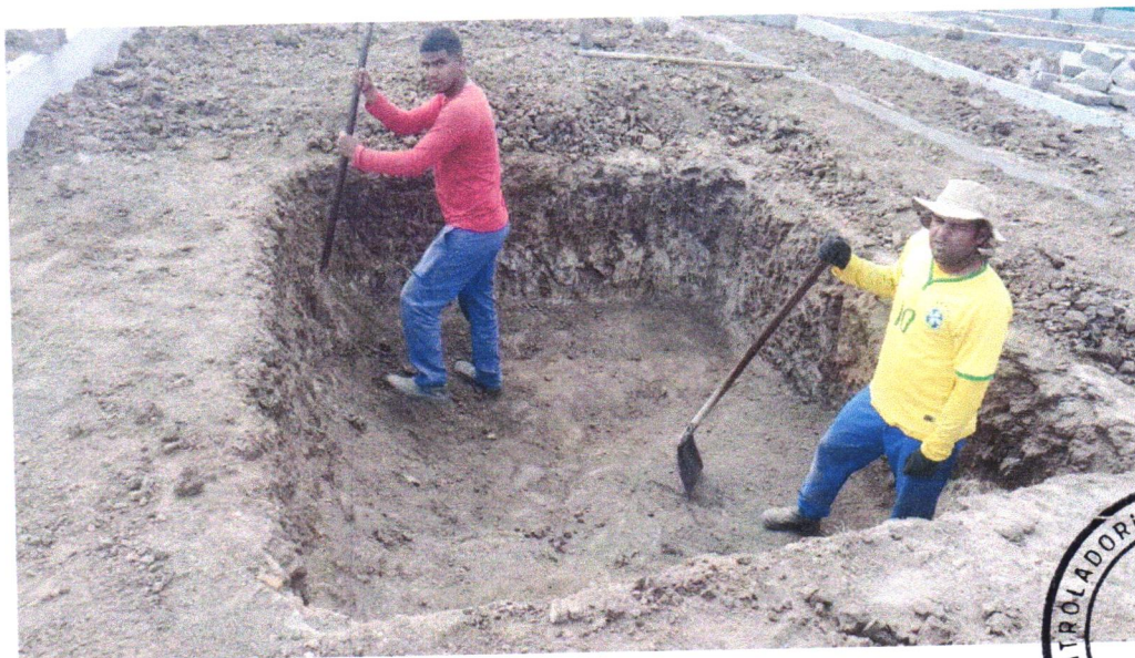
Foto 14 - ESCAVAÇÃO MECANIZADA DE VALA COM PROF. MAIOR QUE 1,5 M ATÉ 3,0 M (MÉDIA MONTANTE E JUSANTE/UMA COMPOSIÇÃO POR TRECHO), RETROESCAV. (0,26 M 3 ), LARG. DE 0,8 M A 1,5 M, EM SOLO DE 2ª CATEGORIA, EM LOCAIS COM BAIXO NÍVEL DE INTERFERÊNCIA. AF_02/2021